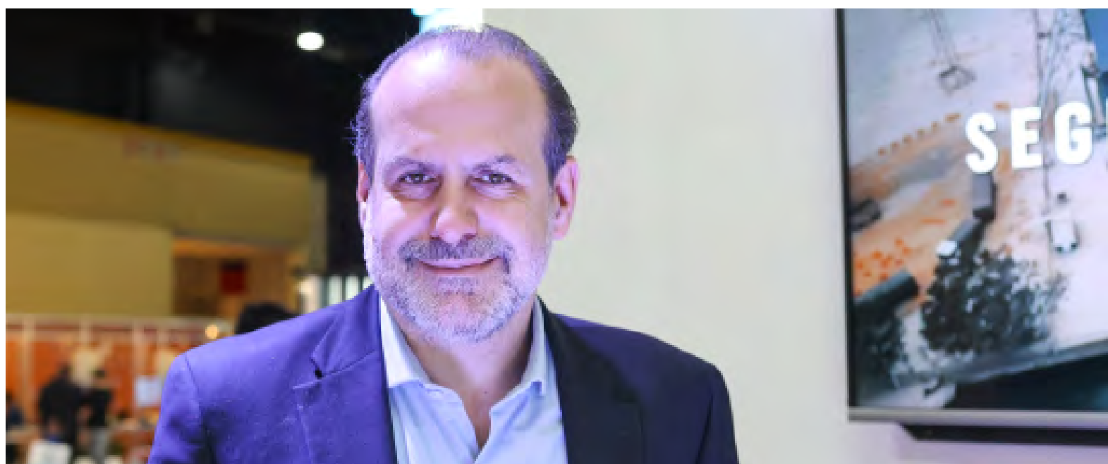
ENTREVISTA A FEDERICO SUSBIELLES, PRESIDENTE DEL CONSORCIO DEL PUERTO DE BAHÍA BLANCA